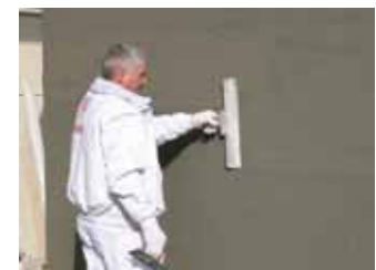
Oberflächen fertig stellen