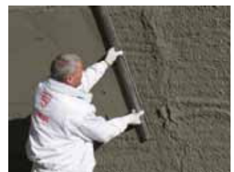
Nochmaliges Zuziehen mit der Kartätsche