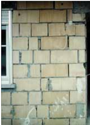
offene Fugen, nicht vollflächig vermauert, zu geringes Überbindemaß

Wichtige Stand- bzw. Wartezeiten werden unter 5.5 beschrieben.