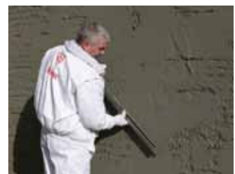
Zuziehen mit der Kartätsche