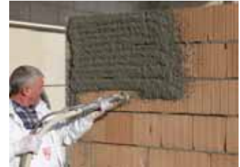
Halbe Lagendicke des Grundputzes vorlegen