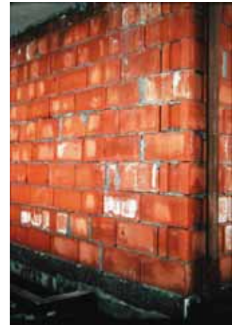
Kritisches Mauerwerk: Offene Fugen, Mörteltaschen, durchnässt

Wenn in Ausnahmefällen die zur ausreichenden Trocknung des Putzgrundes erforderliche Standzeit nicht vollständig eingehalten werden kann, sollten besondere Maßnahmen in Betracht gezogen werden. Dies können z. B. der Auftrag des Putzes auf einen Putzträger oder das zusätzliche Aufbringen eines Armierungsputzes mit vollflächiger Gewebeeinlage auf den Unterputz sein. In jedem Fall soll die Standzeit des Unterputzes auf 2 bis 3 Tage pro mm Putzdicke erhöht werden.