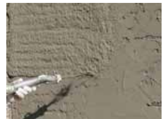
Nach Umschlagen von glänzend in matt, zweite Putzschicht auftragen